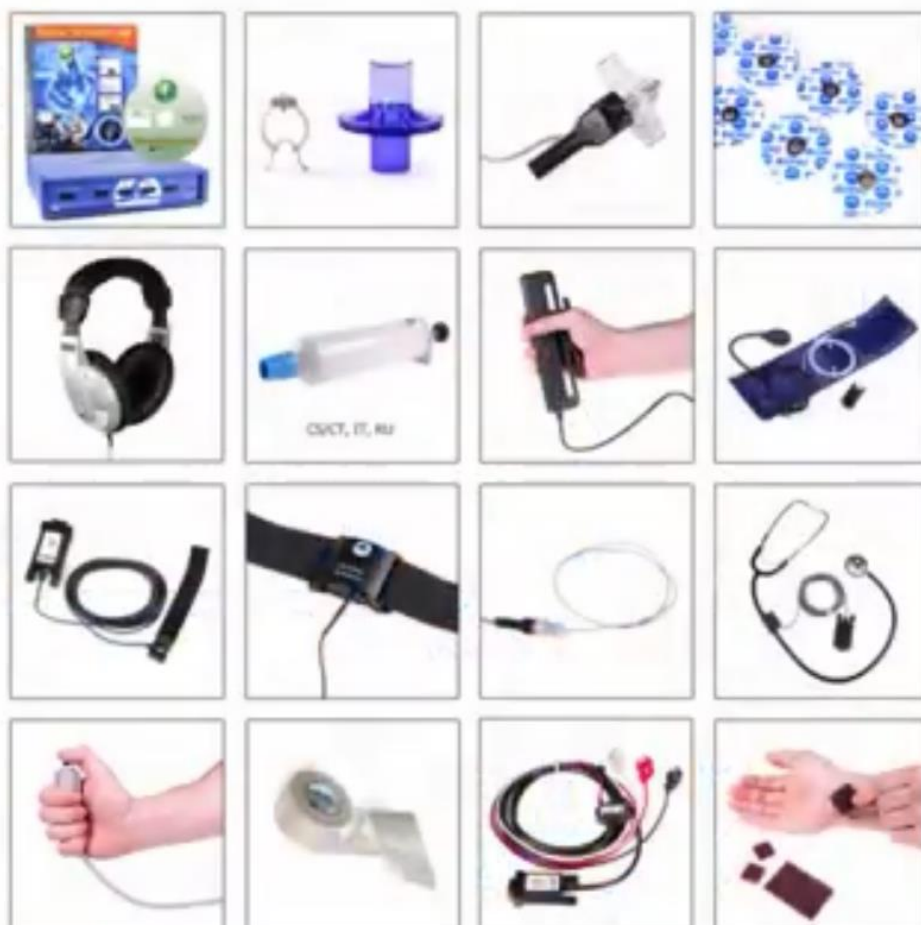
BSL Exercise Physiology and Biomechanics = 27+ Lessons